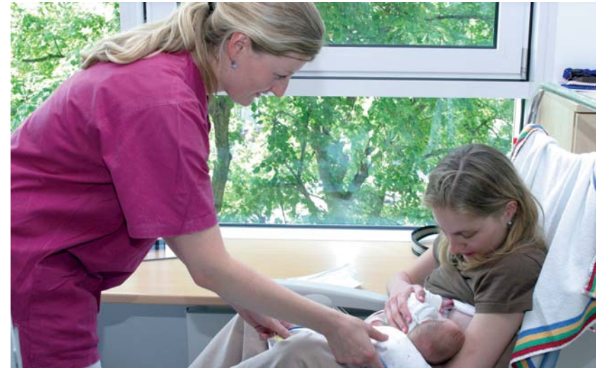
Die Schwester unterstützt beim Stillen

Manche Kliniken übernehmen die Anmeldung des Neugeborenen beim zuständigen Standesamt und organisieren den Versand der Geburtsurkunden. In anderen Kliniken müssen die Eltern dies selbst erledigen. Die Anmeldung des Neugeborenen muss innerhalb einer Woche erfolgen. Kostenfreie Geburtsbescheinigungen erhalten Sie für die Beantragung von Kinder- und Elterngeld, für die Anmeldung bei der Krankenkasse sowie für religiöse Bestimmungen. Die Kontaktdaten des zuständigen Standesamtes nennt Ihnen Ihre Klinik.