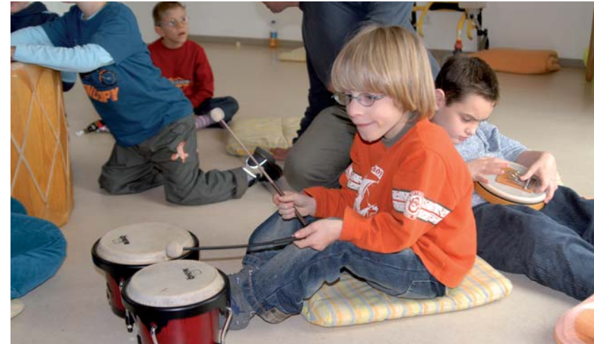
Sollte Ihr Kind später eine weiterführende Therapie benötigen, stellt die Musiktherapie eine gute Möglichkeit dar

Wenn medizinische oder pflegerische Maßnahmen durchgeführt werden, bitte keine Stimme/Musik anstellen, damit das Baby nicht einen Zusammenhang zwischen Störung/Schmerz und Mutterstimme/Musik herstellen lernt.