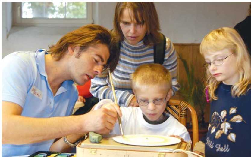
Auch Geschwisterkinder müssen lernen, mit der neuen Situation fertig zu werden

Wenn es gelingt, die Geschwisterkinder in den vorübergehend veränderten Rhythmus der Familie zu integrieren, wird die gesamte Familie Kraft aus dieser Situation schöpfen können und gestärkt aus dieser Zeit hervorgehen.