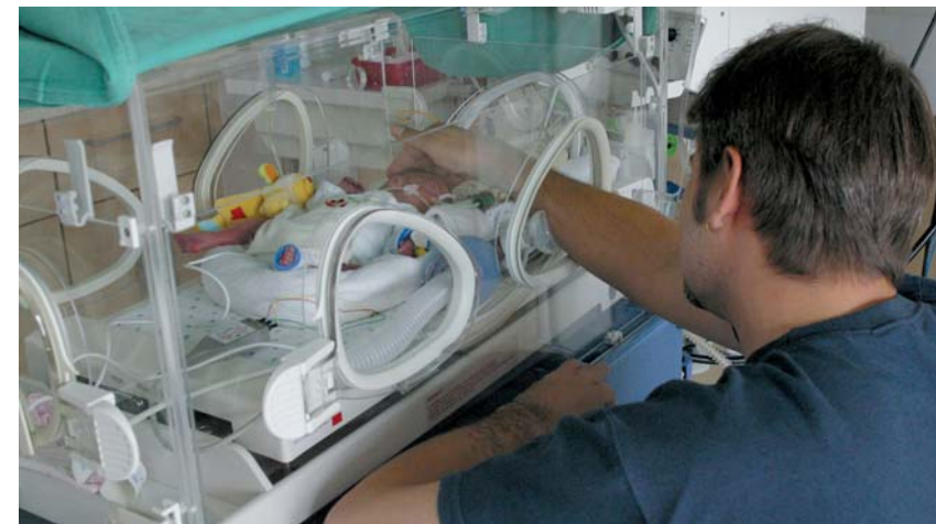
Körperkontakt ist ein wichtiger sensorischer Reiz für das Kind

Wenn das Kind zu schwach ist, um bei unreifer Lunge ausreichend zu atmen, muss es beatmet werden, bis die Lungenfunktion sich ge-