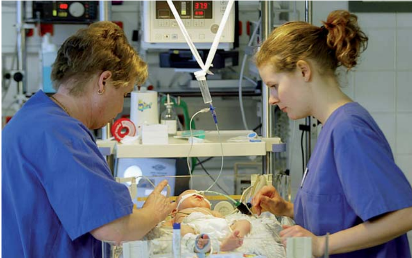
In der Neonatologie findet die Betreuung der Kinder und Eltern im Team statt

zu beobachten und treten bei Frühgeborenen nicht häufiger oder stärker auf als bei Reifgeborenen.