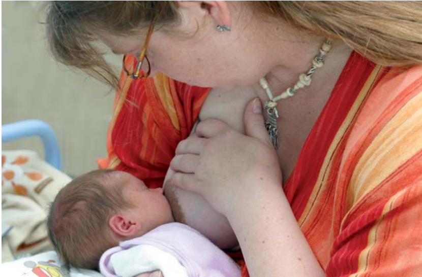
Das Stillen dient nicht nur der Ernährung, sondern erfüllt auch das Bedürfnis nach Nähe

dem Einfluss des Prolaktins keine ausreichende „Grundeinstellung“ erreicht wurde.