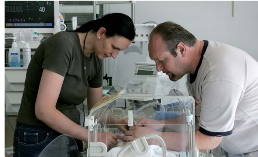
Eltern sollen früh in die Pflege einbezogen werden

Die meisten Eltern finden es unpassend, ihre eigene Befindlichkeit zu thematisieren und bemühen sich vor allem, für ihr Kind da zu sein und im Alltag zu funktionieren. Zweifel an Ihrer Wichtigkeit als Eltern für Ihr Baby, Gefühle von Fremdheit dem Kind gegenüber sind häufig. Zudem fragen sich viele, ob sie zu der zu frühen Geburt des Kindes irgendwie beigetragen haben könnten und haben Sorgen bezüglich der Gesundheit und der weiteren Entwicklung ihres Kindes. Solche Gefühle und Gedanken machen vielen zu schaffen, und Sie als Eltern sollten sich nicht scheuen, das Angebot, darüber zu sprechen, anzunehmen. Diesbezügliche Angebote sind je nach Klinik sehr unterschiedlich. Die Mitarbeiter der Intensivstation können Ihnen aber sicher den richtigen Ansprechpartner vermitteln.